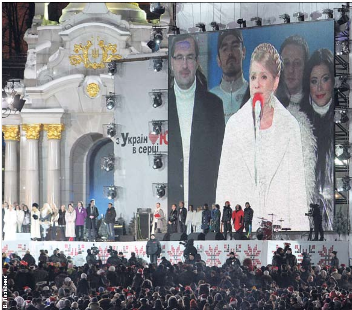
В. Лазебник СнегурЮля. На Майдане было около 100 тысяч человек, народ шутил: «О, Снегурочка! И без Деда Мороза»