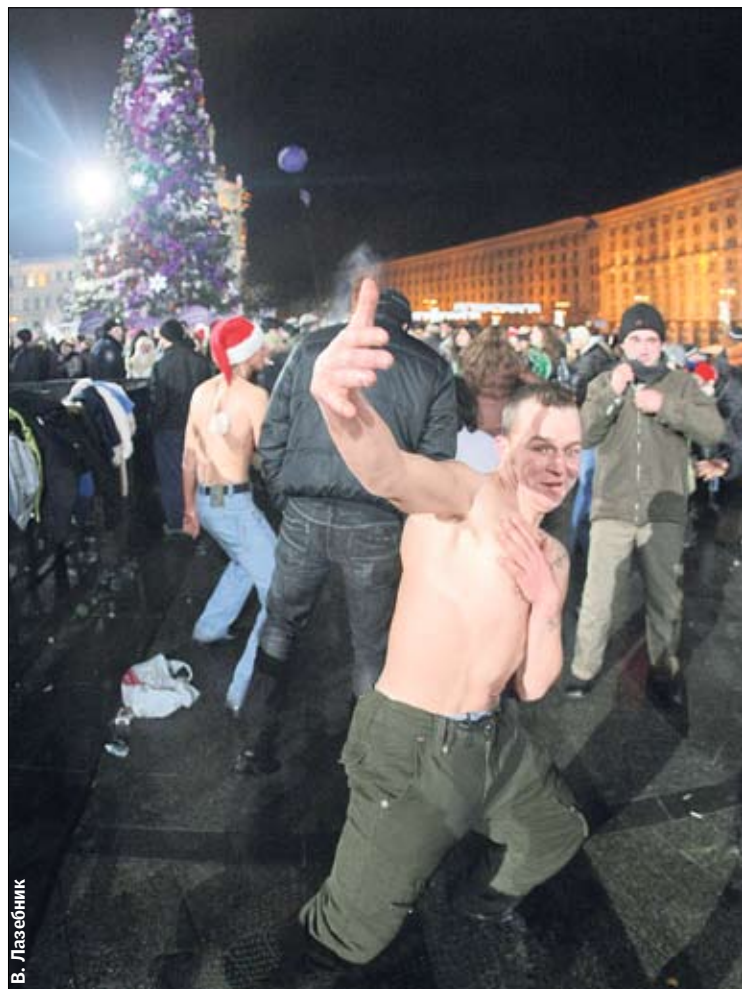
В. Лазебник Жаркий январь 2010-го. Песни и пляски завели молодежь не на шутку