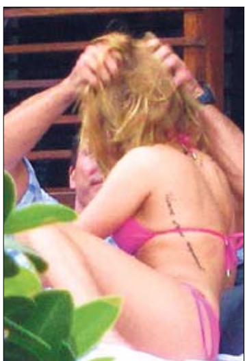
Нежности от чемпиона

■ Семейный Виталий Кличко встречал Новый год в кругу семьи. А вот его брат Владимир наслаждался своим холостым статусом. Еще утром 31 декабря Володя был замечен на пляже Майами с американской актрисой Хайден Панеттйери. Не так давно 33-летний боксер отрицал отношения с 20-летней звездой сериала «Герои». Говорил, они только друзья, иногда ходят вместе на вечеринки. Но в этот раз вездесущие папарацци подсмотрели не только светскую беседу молодых людей. Закусив на пляже и отведав пару коктейлей, парочка под присмотром телохранителя актрисы стала обниматься и вести себя вполне романтично.