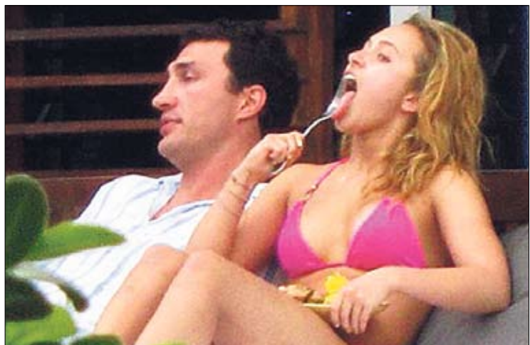
Сладкая жизнь. На Новый год — пляж и десерты